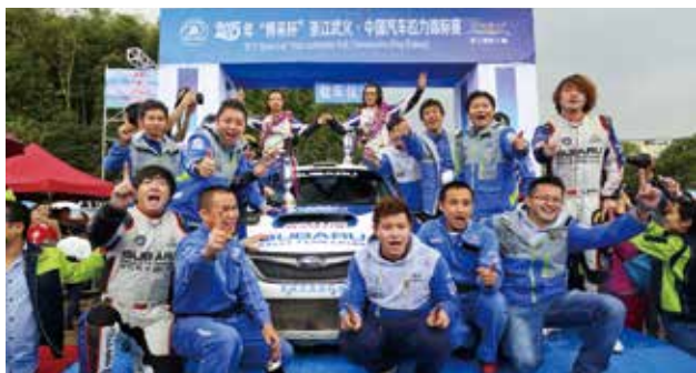
2015CRC武义站车队总成绩