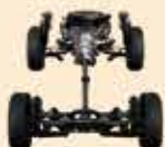
SYMMETRICAL AWD 左右对称全时四驱系统