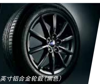
16英寸铝合金轮毂(黑色)

我们知道，他/她们对你来说是如此重要。斯巴鲁，为了守护你所珍视的人，每时每刻都在进行安全技术的研发。全方位保护你，和你想保护的一切。为你所爱，SUBARU SAFETY。