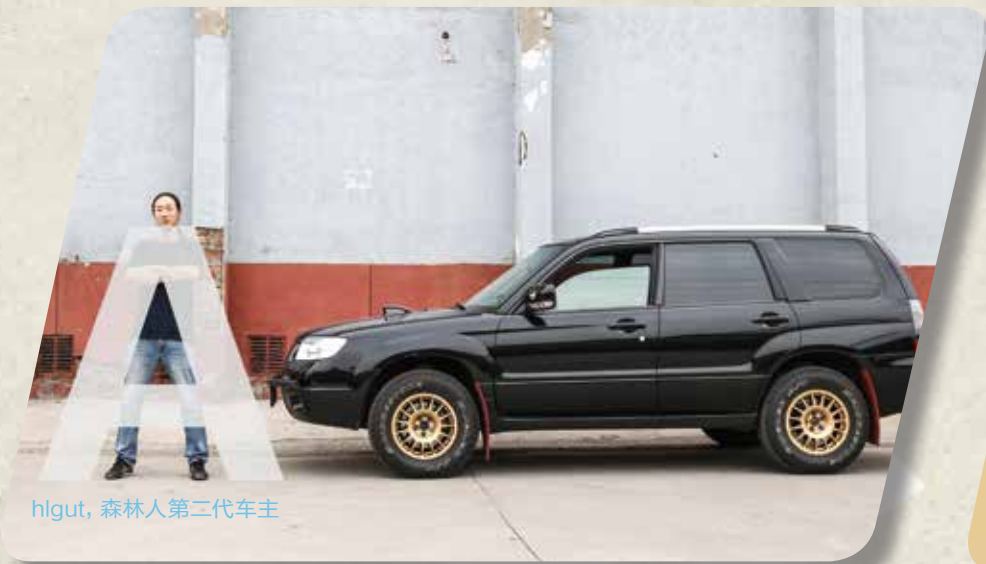
hgut, 森林人第二代车主